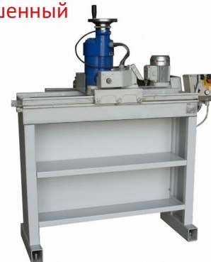
Б/У станок с капитальным ремонтом, неперекрашенный