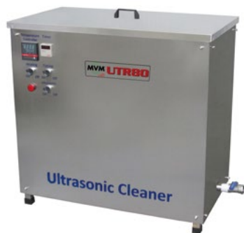
Станок с выставки