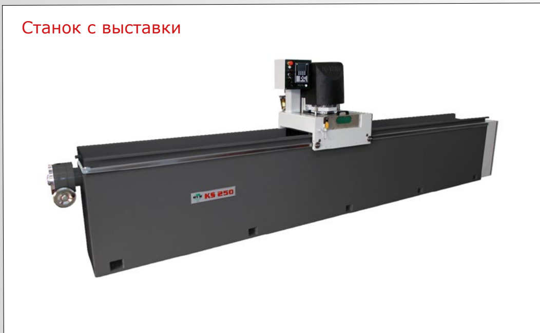
Станок с выставки