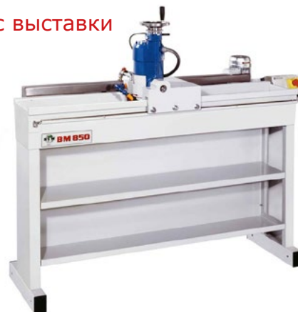
Станок с выставки