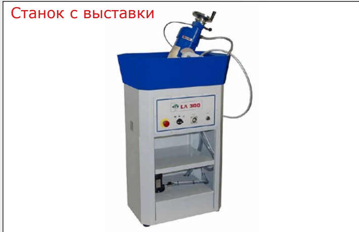
Станок с выставки