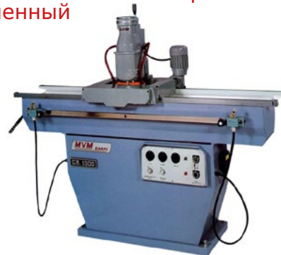
Б/У Станок с капитальным ремонтом, перекрашенный