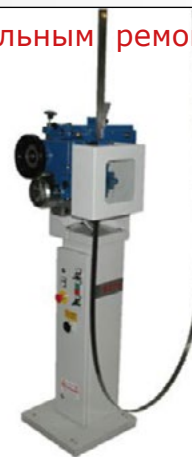
Б/У Станок с капитальным ремонтом, перекрашенный