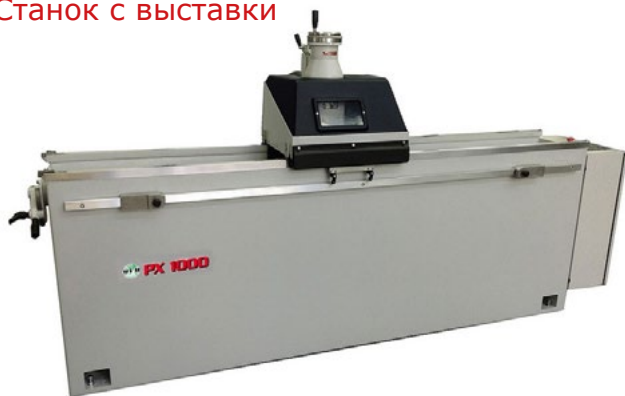
Станок с выставки