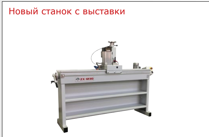
Новый станок с выставки

AFFILELLA это профессиональный заточной станок для кухонных ножей и ножниц. Укомплектован двумя эльборовыми спиральными шлиф.кругами для заточки ножей, одним керамическим шлиф. кругом для заточки ножниц и одним шлиф.кругом для полировки режущей кромки