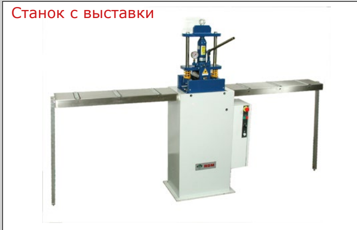
Станок с выставки