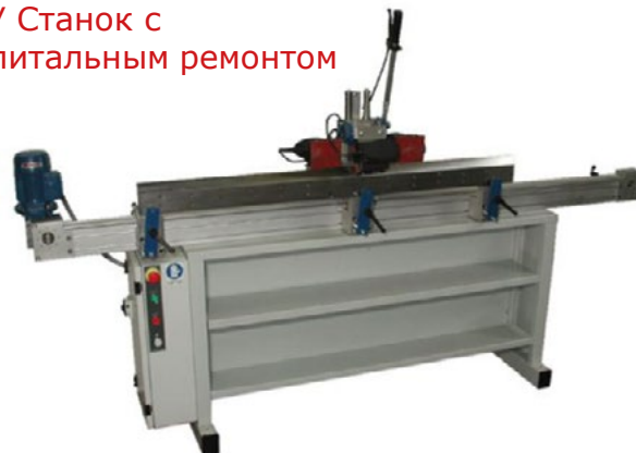
Б/У Станок с капитальным ремонтом