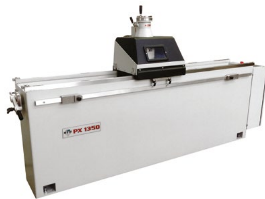
Станок с выставки