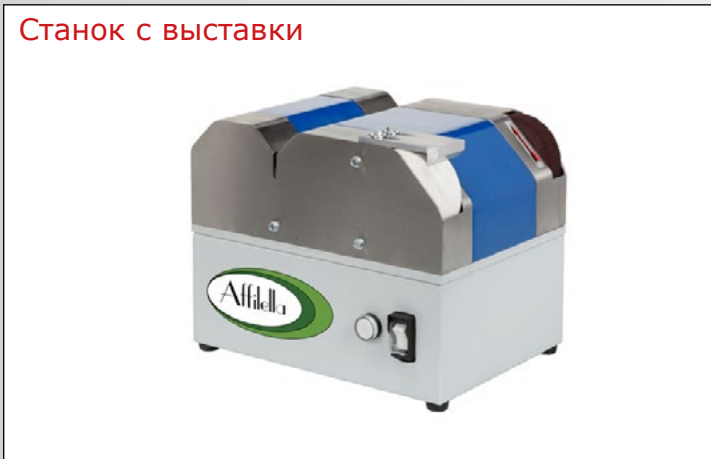
Станок с выставки