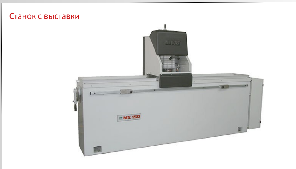
Станок с выставки