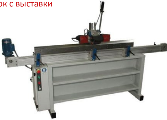
Станок с выставки