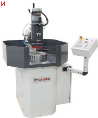
Станок с выставки