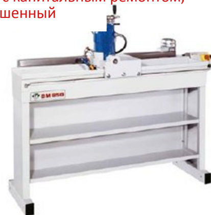
Б/У станок с капитальным ремонтом, неперекрашенный