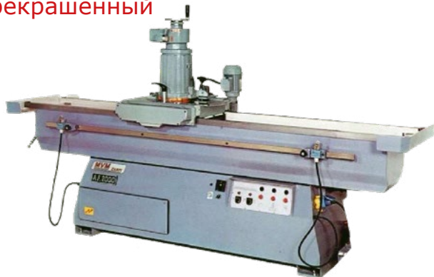
Б/У Станок с капитальным ремонтом, перекрашенный