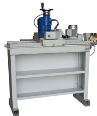
Б/У Станок с капитальным ремонтом, перекрашенный