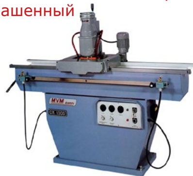
Б/У Станок с капитальным ремонтом, перекрашенный