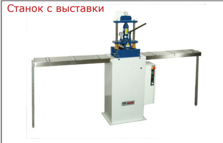
Станок с выставки