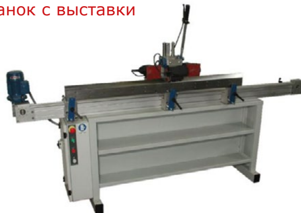
Станок с выставки