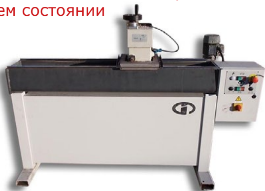
Б/У станок, с капитальным ремонтом, в рабочем состоянии