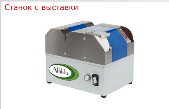
Станок с выставки