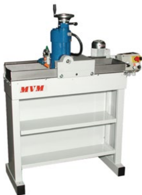
Станок с выставки