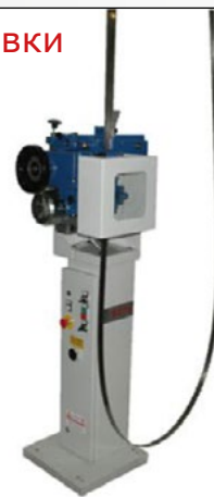
Станок с выставки