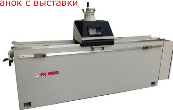
Станок с выставки