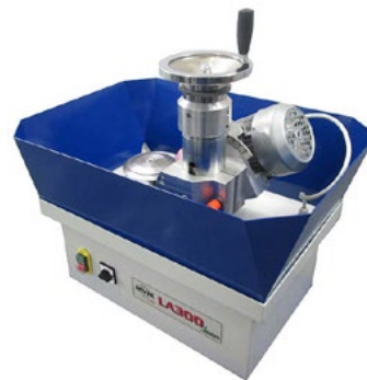
Станок с выставки