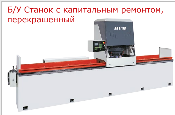
Б/У Станок с капитальным ремонтом, перекрашенный

AFFILELLA это профессиональный заточной станок для кухонных ножей и ножниц. Укомплектован двумя эльборовыми спиральными шлиф.кругами для заточки ножей, одним керамическим шлиф. кругом для заточки ножниц и одним шлиф.кругом для полировки режущей кромки