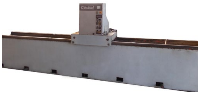
Станок без капитального ремонта, очищен, в рабочем состоянии.