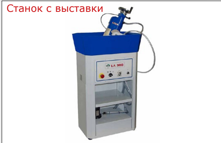
Станок с выставки