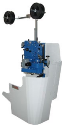
Станок с выставки