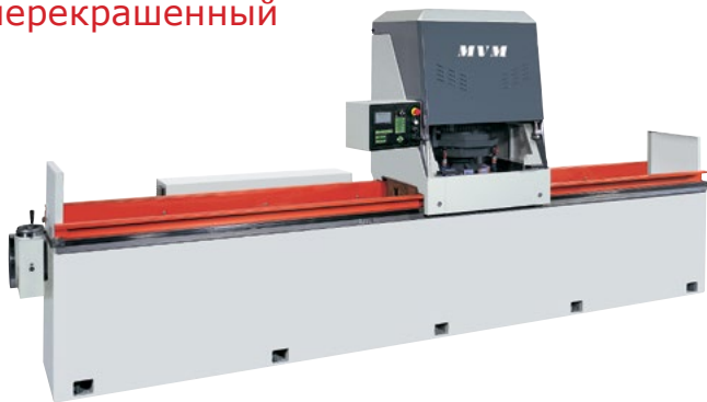
Станок с капитальным ремонтом, перекрашенный