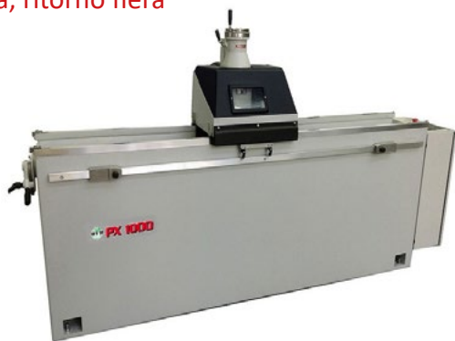
Nuova, ritorno fiera