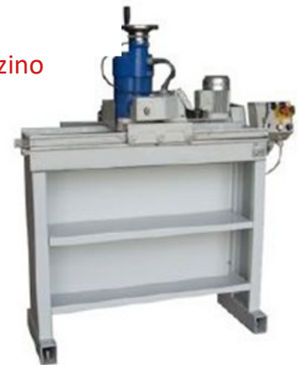
Usata, revisionata, non riverniciata, disponibile a magazzino