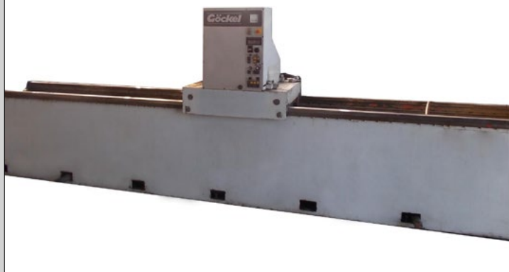
Non revisionata, pulita, funzionante