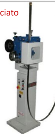
Usato revisionato, riverniciato