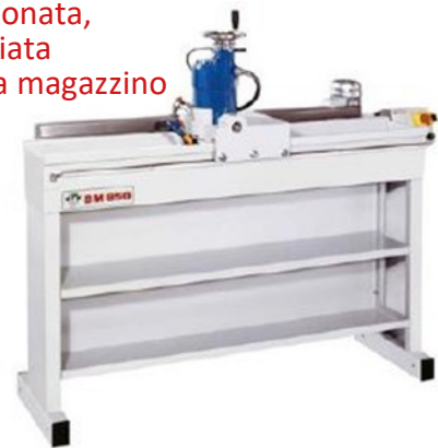
Usata, revisionata, non riverniciata disponibile a magazzino