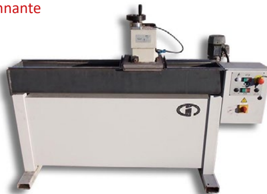
Machine d'occasion pas révisée, propre et fonctionnante