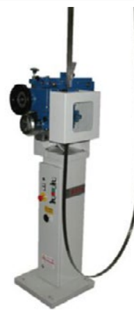
Machine d'occasion révisée