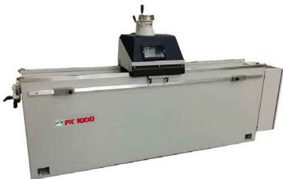
Machine d'occasion révisée, repeinte.