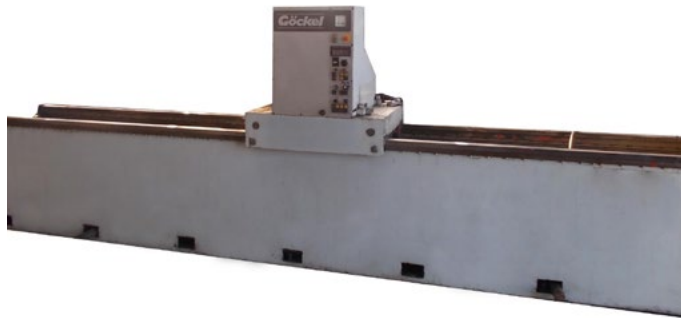
Machine d'occasion pas révisée, propre et fonctionnante