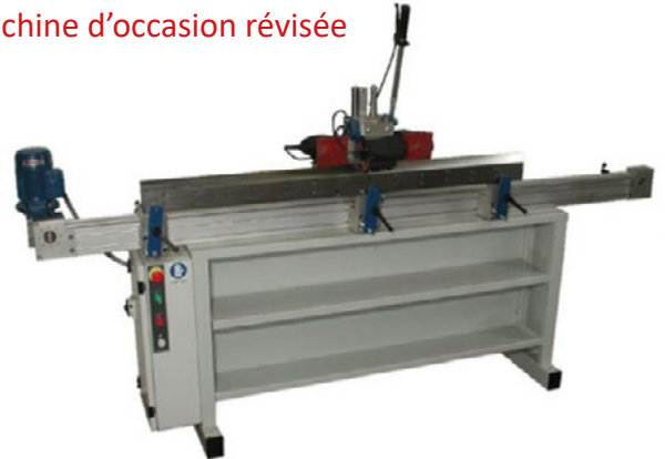
Machine d'occasion révisée