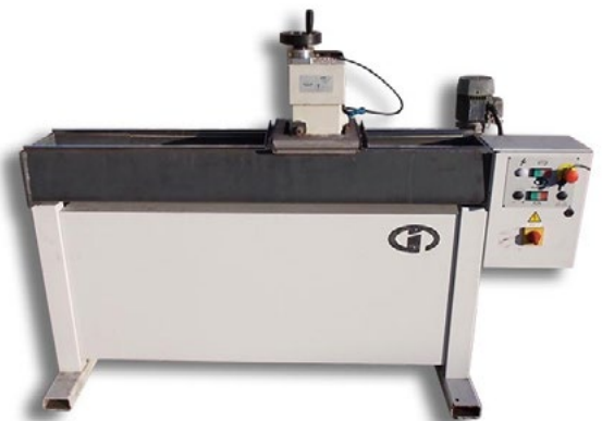
Machine d'occasion pas révisée, propre et fonctionnante