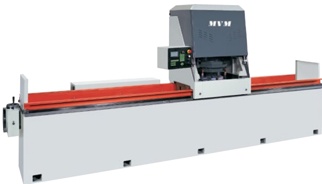
Machine d'occasion révisée